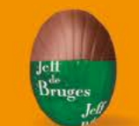
Praliné et éclats de crêpe dentelle