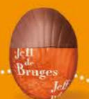
Praliné avec sucre pétillant