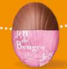
Praliné façon pâte à tartiner