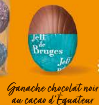
Ganache chocolat noir au cacao d'Équateur