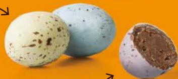
Praliné avec éclats de crêpe dentelle

LE SACHET D'ŒUFS COQUILLE 290 g net 2 RECETTES ASSORTIES : PRALINÉ TENDRE OU PRALINÉ ET ÉCLATS DE CRÊPE DENTELLE, DANS UNE COQUILLE DE SUCRE COLORÉ.