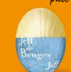
Praliné et éclats de noisettes caramélisées